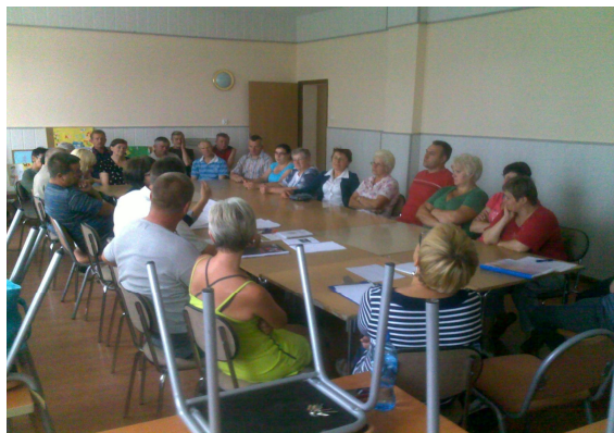
Mieszkańcy Lubomyśla podczas spotkań planistycznych

Plan Odnowy Miejscowości Lubomyśl został opracowany w trakcie dwóch spotkań, które odbyły się w lipcu 2011 roku i zgromadziły 32 mieszkańców. Podstawą opracowania planu był Plan Rozwoju Lokalnego dla gminy Żary opracowany na lata 2007-2010.